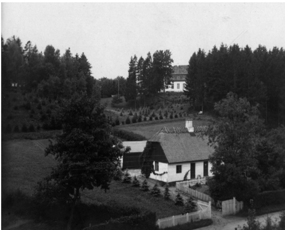
Foto 5. Granhøj i baggrunden og Granhuset ud til Lundtoftevej, 1925.

Granhuset blev revet ned omkring 1930 og lå omtrent hvor Hjortekrogen 1. ligger i dag.