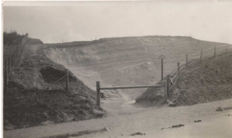
Foto 8. Grusgraven set fra Lundtoftevej.