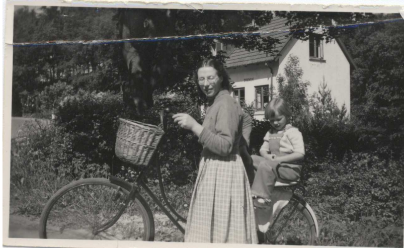
Foto 6. Min mor og mig foran Dybendal, 1954.