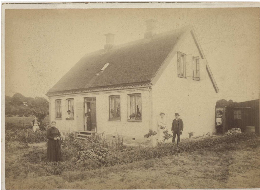
Foto 2. Familien foran det nye hus på Lundtoftevej 298. Sommer 1891.